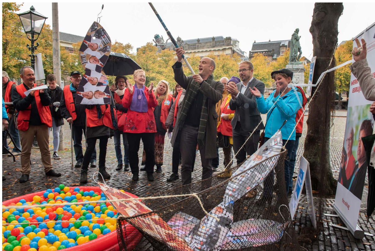
De echte grote fraudevisser-actie februari 2020.

Bij de intake van een cliënt waarschuwde de ambtenaar voor de strengheid van de gemeente. 'Bij het eerste gesprek werd je verteld wat jij allemaal moest doen om in aanmerking te komen voor een uitkering. Als jij je daaraan maar even niet zou houden, dan volgden direct sancties. De ambtenaar kwam trots met voorbeelden die de hardheid van de gemeente moesten onderstrepen.' Zelfs mantelzorg aan oma moest iemand verdedigen. Want 'Iedereen heeft oma's', zo kreeg ze te verstaan. Deze verzuchting tot slot: 'Vroeger moest je ook alle gegevens overleggen, maar daarna (na invoeren Participatiewet) was de toon anders. Daarvóór ervoer ik meer begrip'.