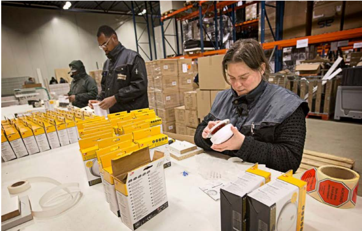
Werknemers plakken stickers op rookmelders in een magazijn, Tilburg.

www.volkskrant.nl/auteur/Trudie Knijn 10 januari 2021, 22:15